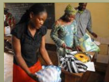
SCHOOLFEEST JUNI 2010 ZOALS IEDER JAAR WAS ER WEER EEN GESCHENKJE ENWAT LEKKERS VOOR IEDEREEN.