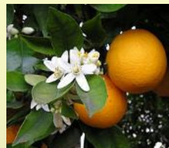
CITRUSBOMEN MANDARIN ORGANGE