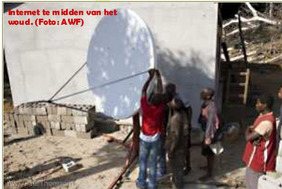
Internet te midden van het woud.

bang zoals ze daar zaten, en wij vroegen ons af: gisteren kwam een slang tussen ons en de bonobo's, wie weet wat kruist ons pad vandaag... een olifant... een luipaard??